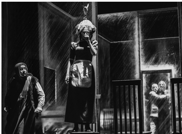
«Железнова Васса. Мать». Свердловский академический театр драмы. Сцена из спектакля.