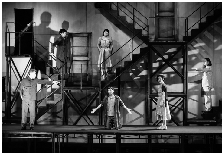
«Преступление и наказание». Театр Читен (Киото, Япония). Сцена из спектакля.

уровнях пять дверей и снабдили каскадом лестниц, напоминающих одновременно пожарные спасательные конструкции и лестницы в спектаклях В.Э. Мейерхольда. Перед стеной выросла приподнятая над уровнем пола площадка во всю ширину сцены – дорога. Она имеет важное значение для Петербурга Достоевского и для г. Миуры. Это прогулочная зона – та, что в романе бульвар К., переулок С., улица М., мост Н. Но герои японского спектакля не прогуливаются – они бродят, как персонажи мистического сна. Хождение и есть существование. Действующие лица романа тоже активные пешеходы, особенно Раскольников. Отличие в том, что шаг японских персонажей почти всегда размерен. Как поэзия. Режиссер заставил всех не спешить и держать руки в карманах. Фигуры, лишенные рук, словно запакованы. Еще одно отличие: в романе люди собираются по углам, комнатам, трактирам. В спектакле все вышли на улицы. Неторопливо они движутся друг за другом малыми группками – живые и трехмерные тени то поднимаются, то опускаются с возвышения на пол сцены.