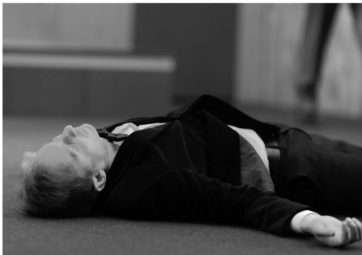
И. Дель – Мармеладов.

«Преступление и наказание». «Приют комедианта».