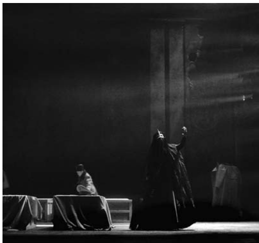
Сцена из спектакля «Золотой петушок». Большой театр

советского образца – раздеться до семейных трусов, а Додона – отрубить голову Полкану (бедный либреттист Бельский...), после чего (из либретто слов не выкинешь) он (Додон) вынужден обращаться с репликой к отрубленной голове. Как тут не вспомнить замечательный эпизод в процессе работы Римского-Корсакова с Бельским. В ответ на одно из предложений Бельского, направленного на усиление образа «бесовского соблазна» Шамаханской царицы, композитор написал: «Если знойная чувственность требует такого же реального выражения, как страдания Иоанна Крестителя, когда ему отрезают голову в “Саломее”, то я ее изгоняю, ибо допускаю только красоту».