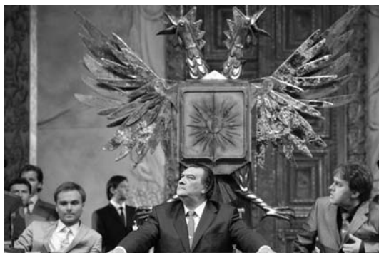
Сцены из спектакля «Золотой петушок». Большой театр. 2011

Серебрянников решил статус странной сказки взломать. На словах объявил, что ставит спектакль вообще не про политику, а про... любовь (!!). Но это так – мистификация для отвода глаз. На деле же применил весь арсенал так называемой «современной» режиссуры, основу которой составляет более или