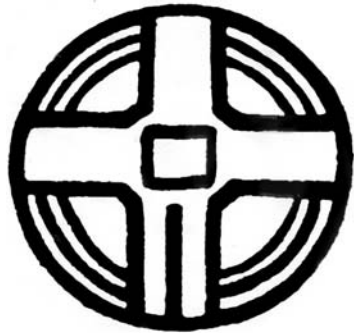
Остов волшебного павильона, приведенного в статье Мейерхольда-Бонди «Балаган»

Но мистификация наивна лишь на первый взгляд. На самом деле