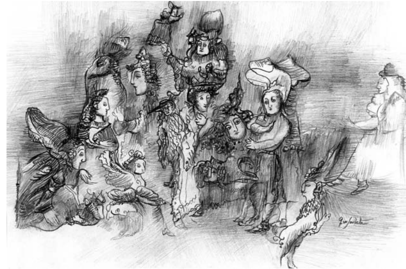
Гаянэ Хачатурян. Рисунок на тему театра.2006

А здание театра, хоть оно и шапито, лишается подвижности, мобильности, возможности свободно дышать пространством. Нельзя не оценить усилий авторов эссе «облегчить» стабильное строение, отчего, я думаю, еще и дополнительно существует мотив выхода в небо. Оттого, я думаю, особо значима беспечная облегченность театрального лоскутного платья (на один вечер – как на карнавал!), а перья, украшающие импровизированный и словно бы необязательный наряд, хоть и взяты от страуса и фазана – тяжеловесных птиц – все-таки птичьи перья, и с ними связаны воздух и полет.