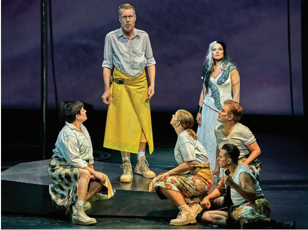
«Парсифаль». Bayreuther Festspiele. Режиссер – Д. Шайб. Сцена из I действия спектакля.

новки, как и пластиковые бутылки в интерьере. Под лейтмотив Веры одна из женщин подходит к Гурнеманцу и ложится на него сверху, он дает себя увлечь. Однако под следующее проведение лейтмотива Тайной Вечери ужасается своей слабости – женщина с покаянным видом удаляется.