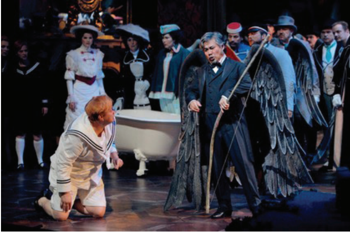
«Парсифаль». Bayreuther Festspiele. Режиссер – Ш. Херхайм. Сцена из I действия спектакля

толкованиями с таким усердием, что череда реверансов перед традицией и неуклюжих компромиссов способна была вызвать чувство неловкости за постановщика.