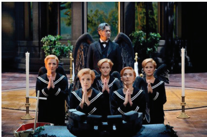
«Парсифаль». Bayreuther Festspiele. Режиссер – Ш. Херхайм. Сцена из I действия спектакля

линии сцены над будкой суфлера у самой рампы полукруг из кирпичей. Это – ларец, где хранится Св. Грааль ( символ-2 ).