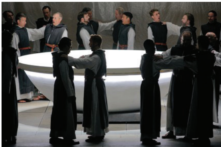
«Парсифаль». Bayreuther Festspiele . Режиссер – У.Э. Лауфенберг. Сцена из I действия спектакля.

Германское национальное возрождение приутихло. Уже пять лет как шла война в Сирии, и Германия всюю принимала беженцев. Войну сопровождала повсеместная атака на христианские храмы и монастыри. Новый «Парсифаль» был «газетным» отзывом на эту повестку.