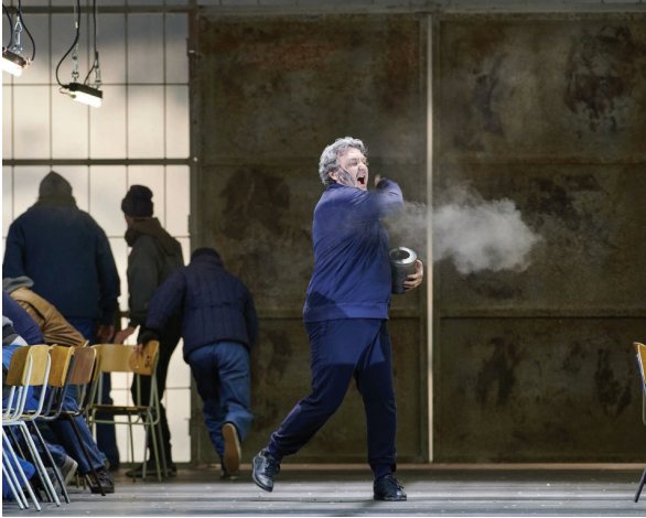
«Парсифаль». Wiener Staatsoper. Сцена из III действия спектакля

он создает предпосылки для драмы-мистерии. Так как герой этого романа приобщается Божественной силе не интуитивно, а осознанно, то и драма-мистерия становится драмой Богопознания . Ее действие – ребус, подлежащий разгадке самим зрителем. От него требуется особый тип активности, который вел бы от душевного сопереживания происходящему к пониманию и осознанию его идеи. При этом суггестивный момент у Вагнера, в отличие от мистерии модернизма, еще тщательно сопряжен с рациональной концепцией сюжета и логичностью его развертывания.