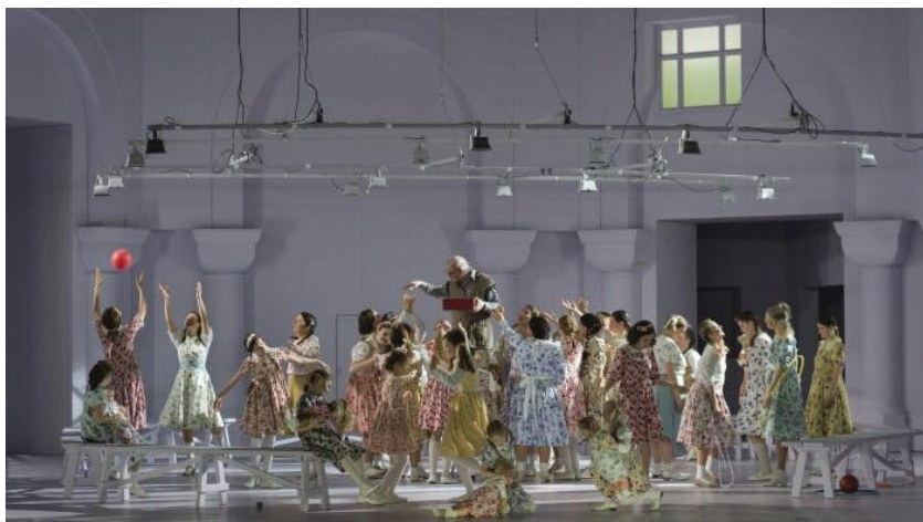
«Парсифаль». Staatsoper (Берлин). Сцена из II действия спектакля.

Амфортасу, и то, сменив короткие штаны на длинные, а худы на кожанку, резко возмужавший Парсифаль запросто отнимал у плюгавого Клингзора копье (и здесь никакого чуда) и пронзал его, пресекая попытку низложить лидера «байрейтской» секты. Тем самым вся христианская мотивика сюжета Вагнера (евангельская предыстория, литургия) последовательно упразднена в самом корне.