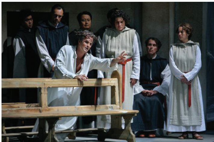
«Парсифаль». Bayreuther Festspiele. Режиссер – У.Э. Лауфенберг. Сцена из I действия спектакля.

Амфоргас вновь уподоблен Христу в полном противоречии замыслу Вагнера, а обряд решен так, что критики дружно возопили: режиссер показывает публике секту. Однако шокирующая картина-перпендикуляр была предельно внятно выстроена как символ и буквально иллюстрировала представление Вагнера о роли Христа в человеческой истории. Характер зависимости, в которой Христос-Богочеловек пребывает от людей, он разъяснил в последней законченной статье «Геройство и христианство»: соединение людей со Христом происходит через физико-метафизическую субстанцию крови; та Божественная Кровь Спасителя, что однажды влилась в людей по свершении Его крестного подвига любви и сострадания, людьми испорчена; страдания Христа делятся 28 . «Парсифаль» – призыв Вагнера человечеству избавить Его от этих страданий. Режиссер воспринял и со всей возможной остротой точно визуализировал на сцене мысль Вагнера, увлеченного обрядом католической мессы-жертвы, в которой каждый раз символически повторяется Крестная жертва Христа во имя людей.