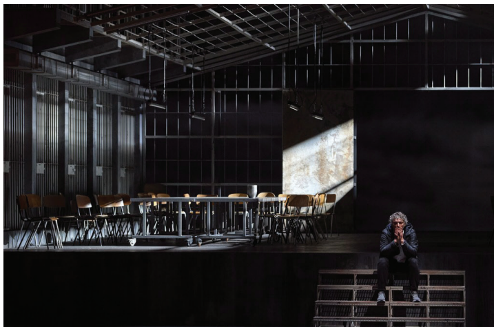
«Парсифаль». Wiener Staatsoper . Сцена из III действия спектакля

Возможно, поэтому Джеймс Левайн, дирижер байрейтской постановки к 100-летию «Парсифаля» (1982), в согласии с автором резко возражал Гетцу Фридриху против открытия занавеса во время Вступления 10 .