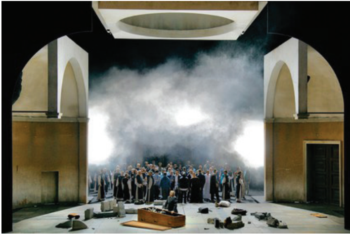
«Парсифаль». Bayreuther Festspiele . Режиссер – У.Э. Лауфенберг. Сцена из III действия спектакля.

у чародея – набор магических орудий. В финале акта, завладев Св. Копьем, Парсифаль ломал его и превращал в крест. Коллекция распятий обрушивалась на пол. Главная коллизия II акта – противостояние покушению на чистоту героя – была показана как религиозный конфликт.