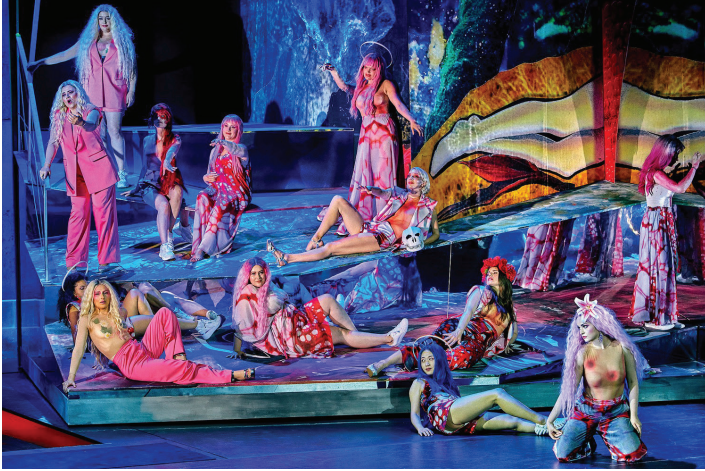
«Парсифаль». Bayreuther Festspiele . Режиссер – Д. Шайб. Сцена из II действия спектакля.

Весь спектакль на сцене действует оператор с камерой, и съемка проецируется на задник. Парсифаль одет в пляжное: майка с сердечками ( символ его способности к состраданию) и шорты – еще один штамп, пришедший сразу из двух предыдущих постановок. Все матерые героические тенора в коротких штанишках выглядят нелепо. В диалоге герои статичны и почти не взаимодействуют.