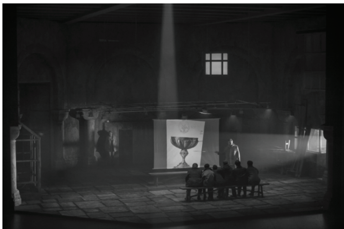
«Парсифаль». Staatsoper (Берлин). Сцена из I действия спектакля.

(Он) жаждет неарийского секса и арийского спасения и потому благоразумно содержится под надзором братьев, численность которых критически уменьшилась из-за их подверженности соблазнам внешнего мира» 33 .