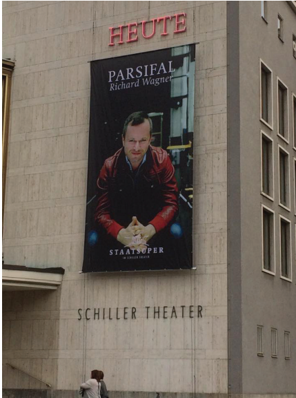
Афиша «Парсифаля» в постановке Д. Чернякова. Берлин

автору. Когда за пультом оказывается такая личность, как Баренбойм, спектакль сразу улетает в иное измерение и длится минут на 15 дольше байрейтского стандарта.