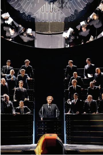
«Парсифаль». Bayreuther Festspiele . Режиссер – Ш. Херхайм. Сцена из III действия спектакля

первого послевоенного фестиваля воздержаться от обсуждения политики. После чего на сцене храмом оказывался зал современного немецкого парламента, а его спикером – король Амфортас. Депутаты негодовали, что из-за него утратили контакт со святыней Грааля, тот слагал с себя полномочия, и Парсифаль заступал на его место. Тогда из условного ларца, хранящего Грааль, являлся главный «символизиант» святыни – Мальчик. Мать-Кундри и Гурнеманц обнимали его. Перед публикой стояла счастливая немецкая семья – источник традиционных духовных ценностей восстановлен.