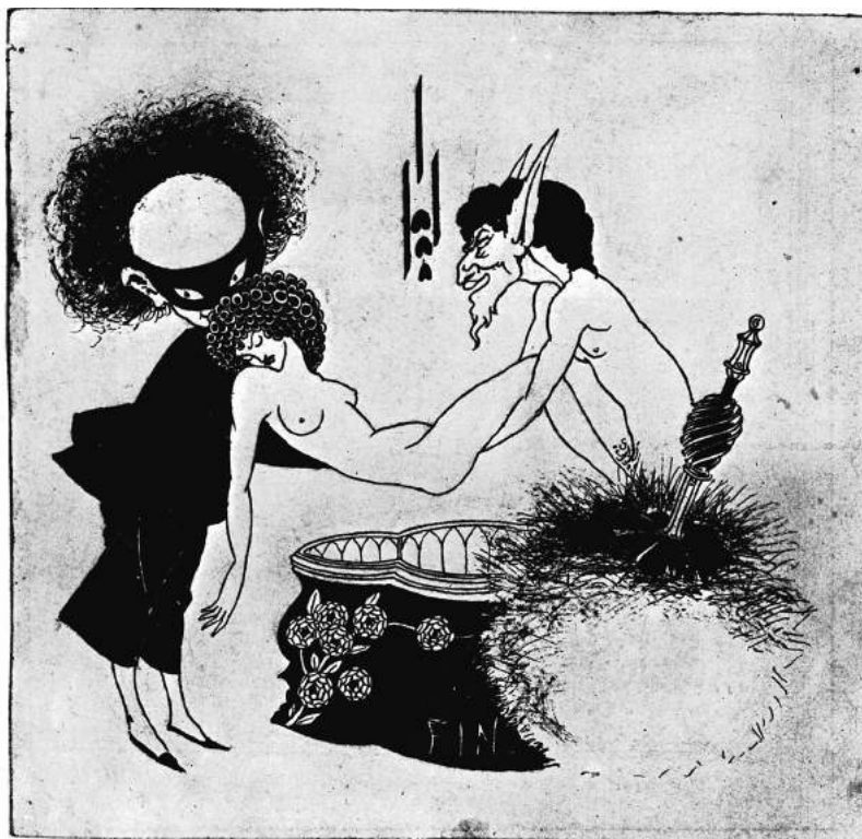
О. Бердслей. «Похороны Саломеи», 1893г., чернила и карандаш на веленовой бумаге, 16,4 x 17,4 см., собрание Музея Фогга, Гарвардские музеи искусств, Кембридж