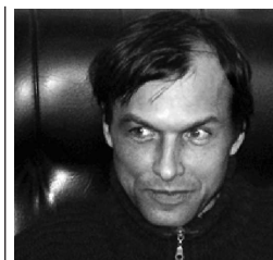
1 Казьмина Н. Голый пионер // Театр, 2005. № 2.

1) Почему за 9 месяцев граду и миру не было представлено ни одного сколько-нибудь внятного предложения ни по одному вопросу, касающемуся реальной жизни людей? Кстати, и по культурной политике – тоже ни слова.