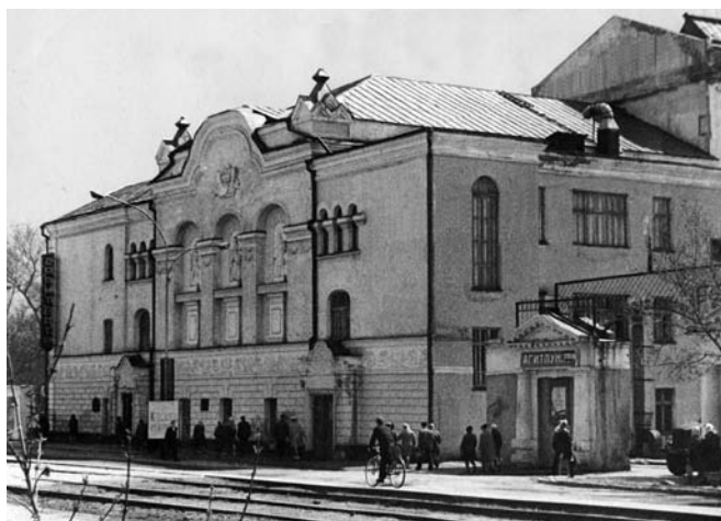
Здание Барнаульского театра, где Камерный театр набирал Студию

Занятия в Студии идут уже третью неделю. Со своим дьявольским характером приходится часто нервничать, отстаивая свое место в коллективе. Порой в душе закипает что-то близкое к отчаянию,