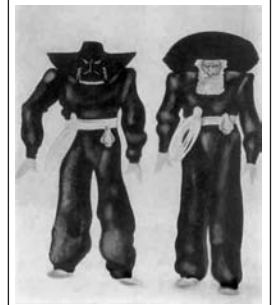
Палач. Эскиз Н. Акимова

Как всегда в судьбе Акимова «кстати» подоспела статья «Вредная сказка», где о «Драконе» было сказано, что это «пасквиль на героическую освободительную борьбу народов с гитлеризмом». «Дракон – это палач народов. Но как относятся к нему жители города, которых он угнетает? Тут-то и начинается беспардонная фантазия Шварца, которая выдает его с головой. Оказывается, жители в восторге от своего дракона. «Мы не жалуемся. Пока он здесь, ни один другой дракон не осмелится нас тронуть», <...> народ предстает в виде безнадежно искалеченных эгоистических обывателей <...> Мораль этой сказки заключается в том, что незачем, мол, бороться с драконом – на его место встанут другие драконы поменьше; да и народ не стоит того, чтобы ради него копыя ломать; да и рыцарь борется только потому, что не знает всей низости людей, ради которых он борется» 6 . Т.е. на самом деле смысл и истинное значение этой «сказки на все времена»