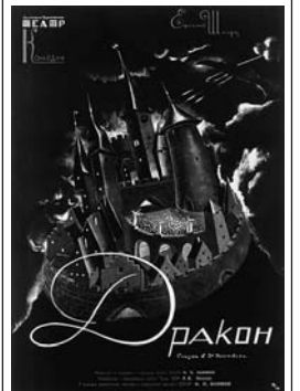
Плакат Н. Акимова к спектаклю. 1962