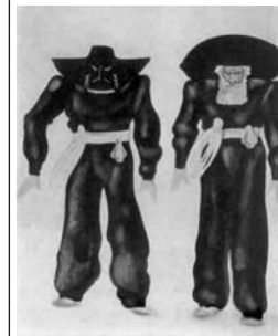
Палач. Эскиз Н. Акимова

Как всегда в судьбе Акимова «кстати» подоспела статья «Вредная сказка», где о «Драконе» было сказано, что это «пасквиль на героическую освободительную борьбу народов с гитлеризмом». «Дракон – это палач народов. Но как относятся к нему жители города, которых он угнетает? Тут-то и начинается беспардонная фантазия Шварца, которая выдает его с головой. Оказывается, жители в восторге от своего дракона. «Мы не жалуемся. Пока он здесь, ни один другой дракон не осмелится нас тронуть», <...> народ предстает в виде безнадежно искалеченных эгоистических обывателей <...> Мораль этой сказки заключается в том, что незачем, мол, бороться с драконом – на его место встанут другие драконы поменьше; да и народ не стоит того, чтобы ради него копыя ломать; да и рыцарь борется только потому, что не знает всей низости людей, ради которых он борется» 6 . Т.е. на самом деле смысл и истинное значение этой «сказки на все времена»