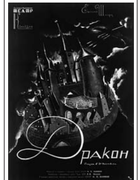
Плакат Н. Акимова к спектаклю. 1962